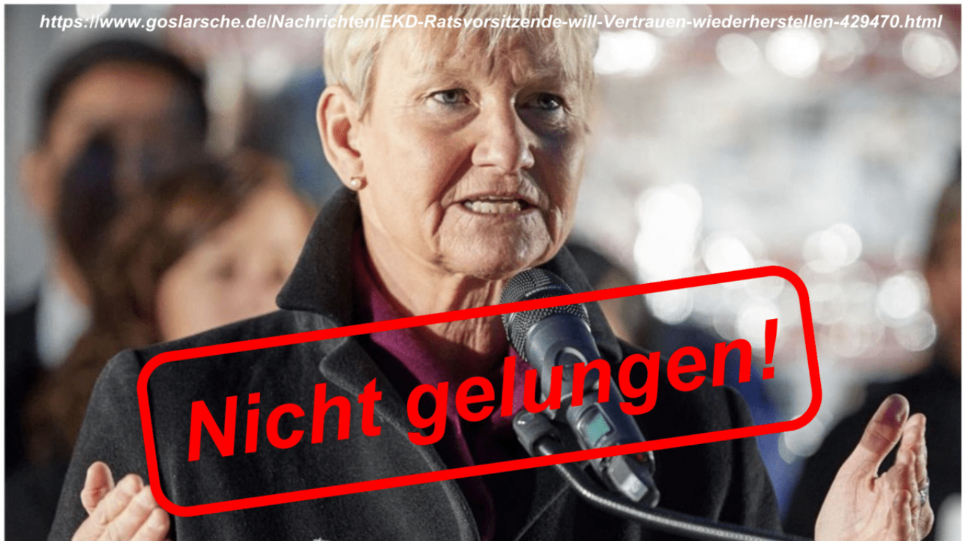
Kirsten Fehrs, Bischöfin im Sprengel Hamburg und Lübeck.